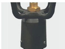
Торшерное исполнение для опоры Ø 60 мм