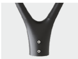
Торшерное исполнение для опоры Ø 60 мм